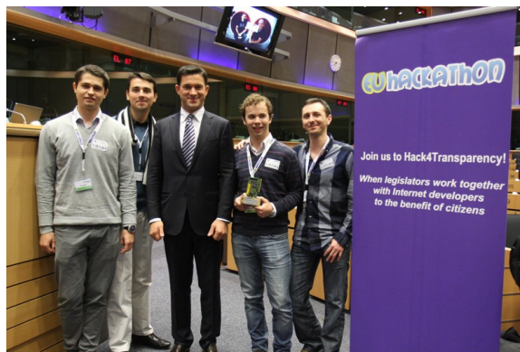
Echipa României premiata la Bruxelles

Mai multe informații de spre acest eveniment puteți găsi la următorul link: